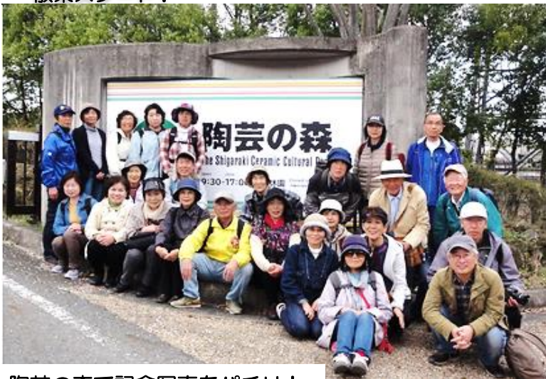
陶芸の森で記念写真をパチリ！