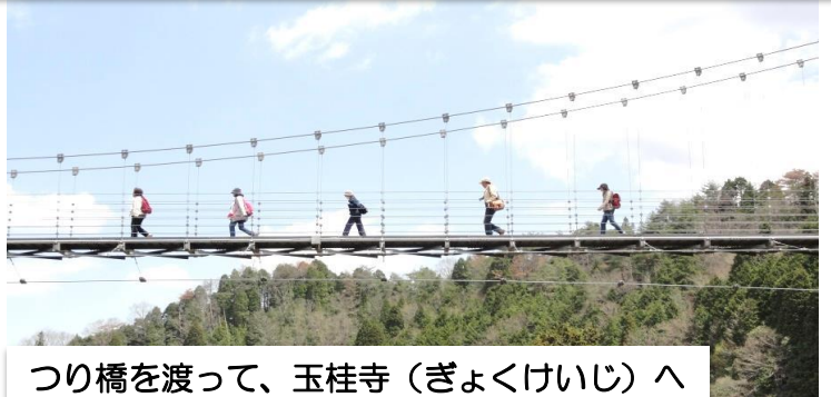
つり橋を渡って、玉桂寺（ぎょくけいじ）へ