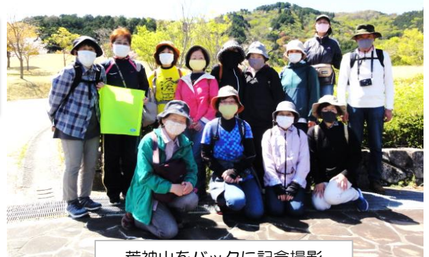
荒神山をバックに記念撮影

昨年4/3に実施した時は、ちょうど桜が満開でしたが、 今年は季節の歩みが早く、雨の後と重なり名残りの桜となりました。