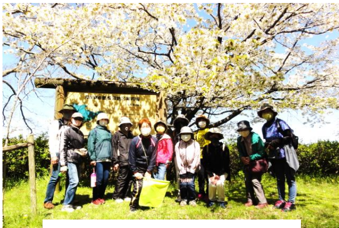
緑地公園内の花が満開の木の下で集合写真

荒神山ふもとの7和ウォーク 青空のもと会話も弾み 楽しいひとときを過ごしました。